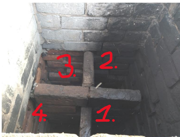
Līdzda 8. dūmvadā.