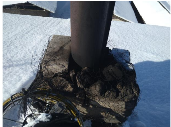
Kanāls nr. 4