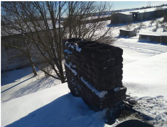
Kanāli nr.11-13 un 30-32