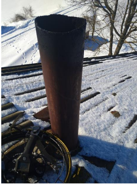
Kanāls nr. 8