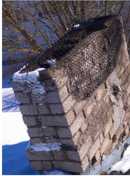
Kanāls nr.10 un 25-29