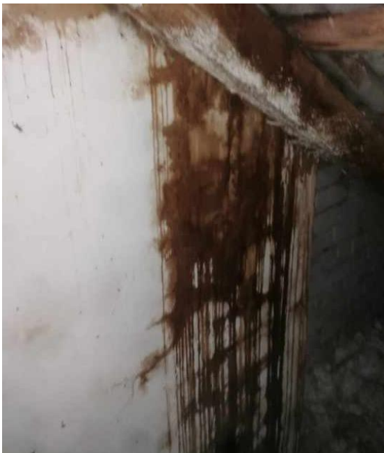
Dūmkanāls nr. 1 bēninu daļā.

Pakalpojuma veicējs: Ints Celmiņš [Dokuments ir parakstīts elektroniski ar derīgu laika zīmogu] (vārds, uzvārds, paraksts)