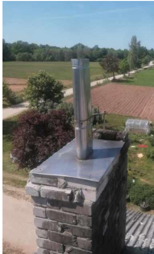
Kanāli nr. 7 un 1 virs jumta