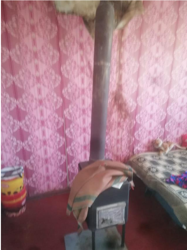
Krāsns nr. 11.