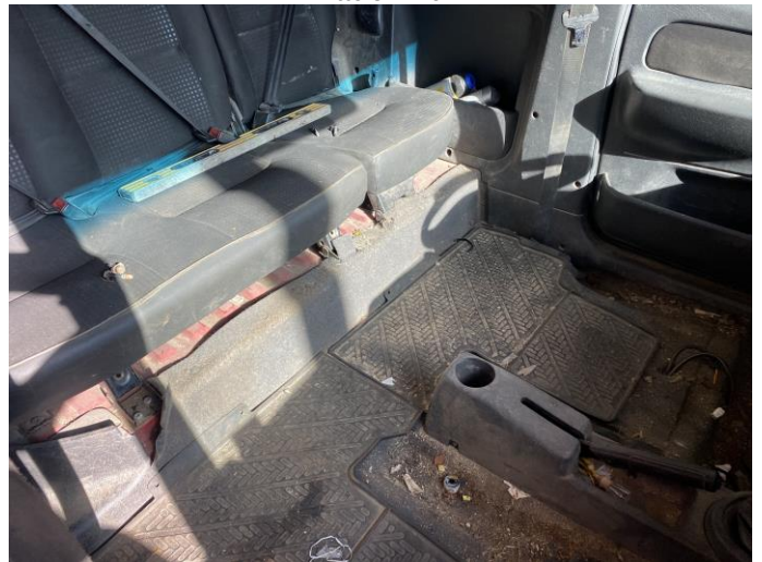
Attēls Nr. 10