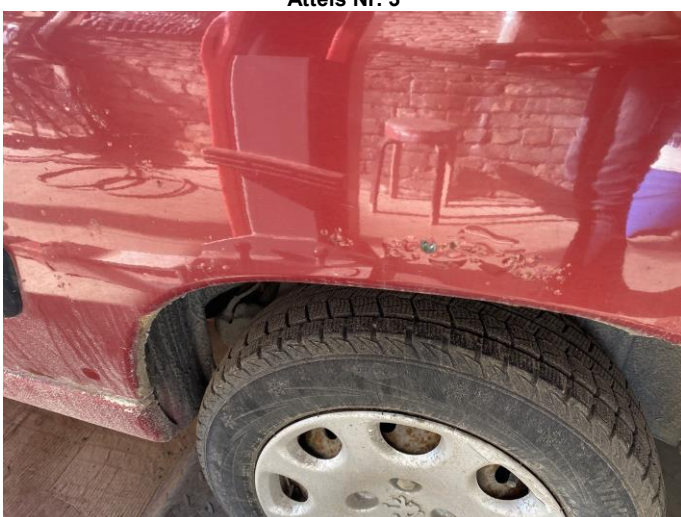
Attēls Nr. 5