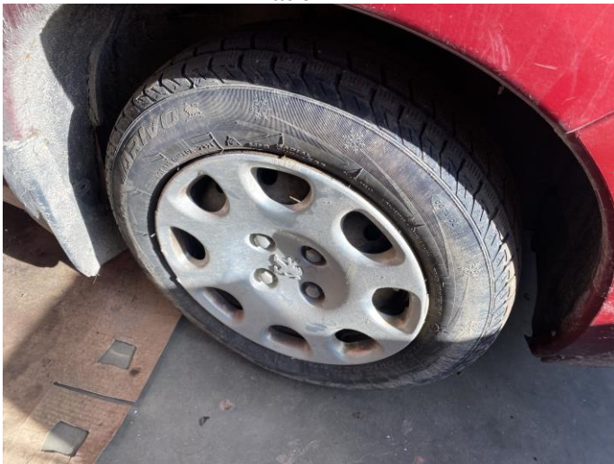
Attēls Nr. 9