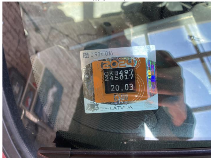
Attēls Nr. 12