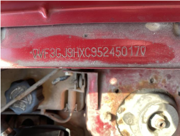
Attēls Nr. 7