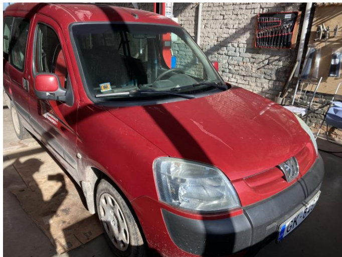
Attēls Nr. 2