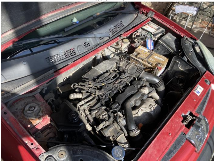
Attēls Nr. 11