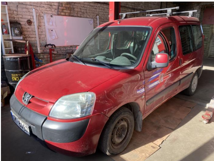
Attēls Nr. 1