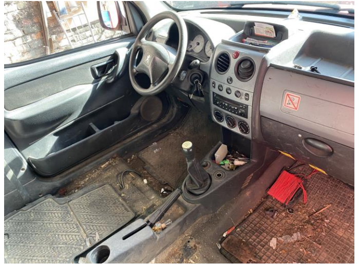
Attēls Nr. 8