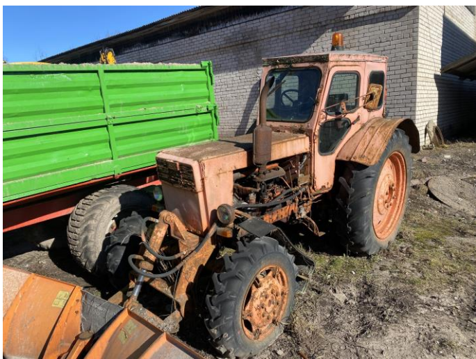
Attēls Nr. 1