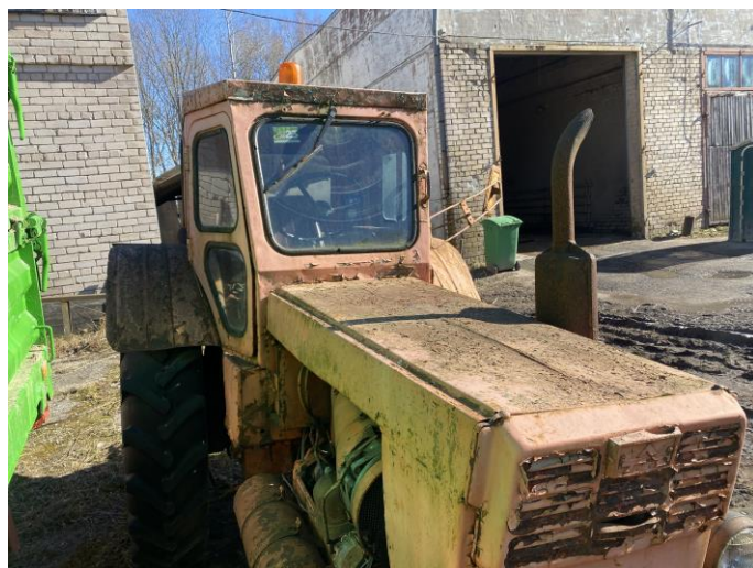
Attēls Nr. 2