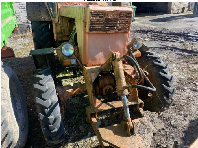
Attēls Nr. 5