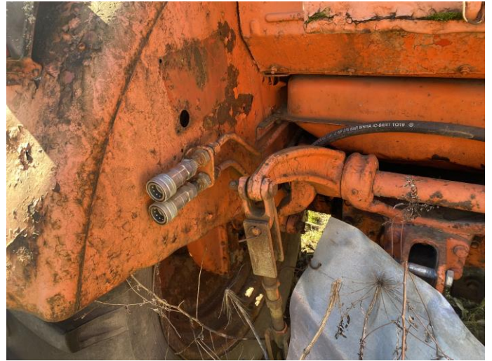
Attēls Nr. 8