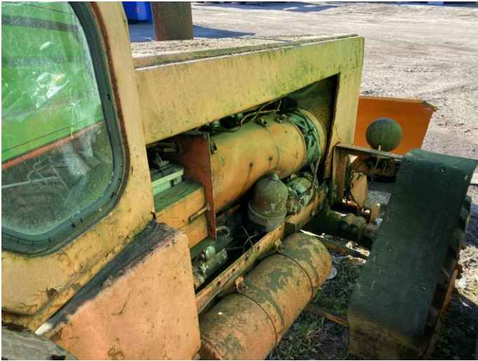
Attēls Nr. 7