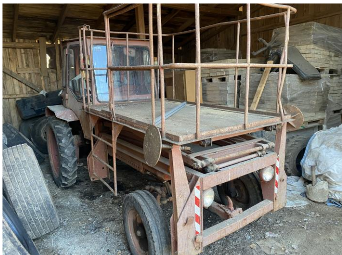
Attēls Nr. 1