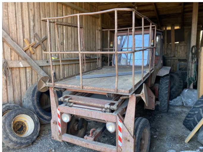
Attēls Nr. 2