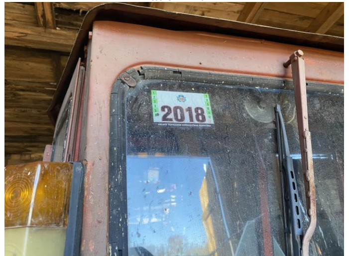
Attēls Nr. 12