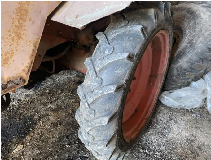
Attēls Nr. 11