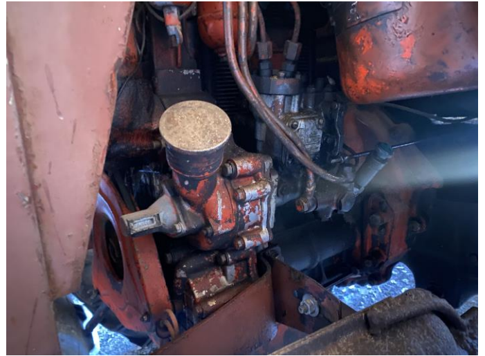
Attēls Nr. 8