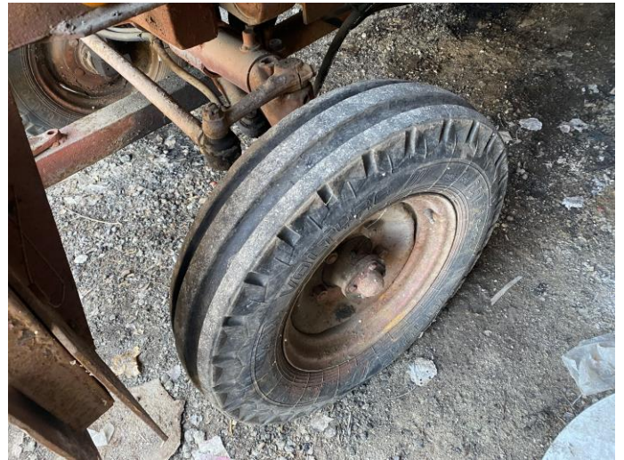
Attēls Nr. 10