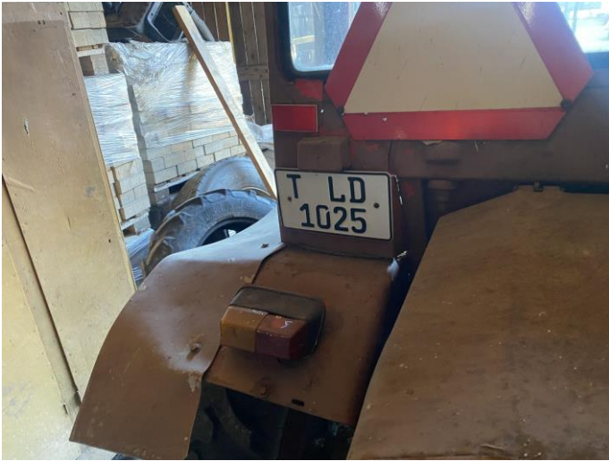
Attēls Nr. 7