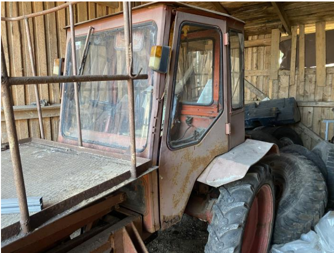
Attēls Nr. 9